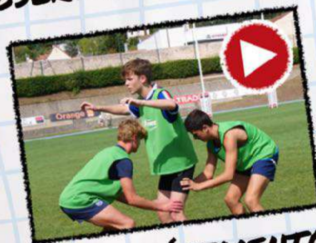
RÈGLE EXPÉRIMENTALE DE LA TOUCHE EN MI4