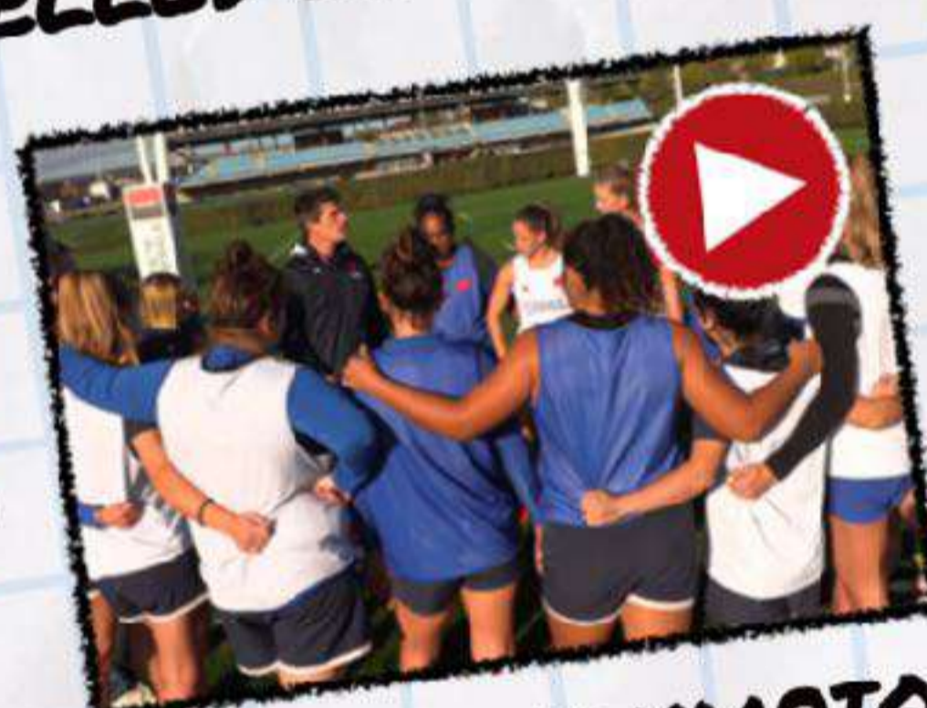
ACADÉMIE OLYMPIQUE PÔLE FRANCE FÉMININ