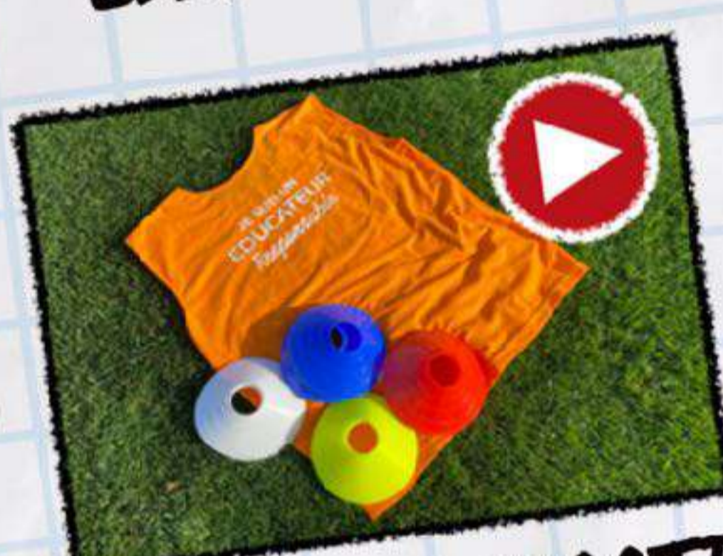
ÉDUCATEUR SPORTIF : QUELLES OBLIGATIONS ?