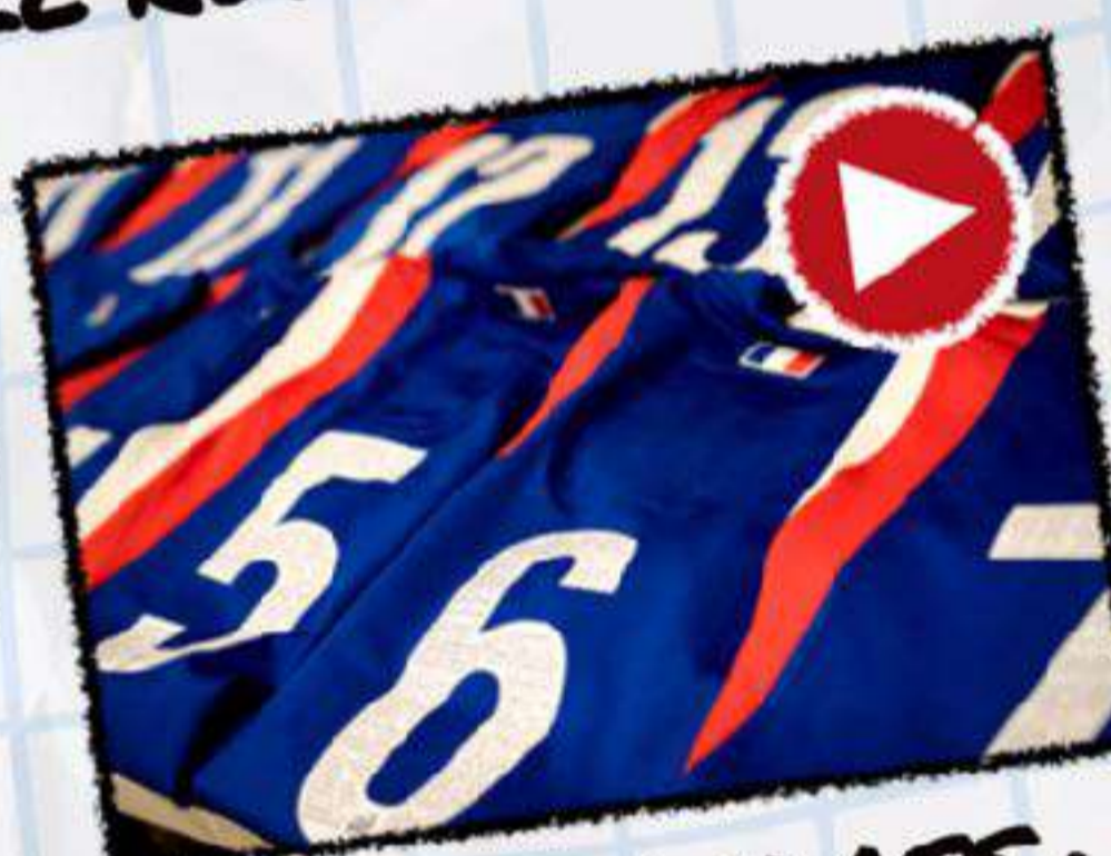
MASTERCLASS : OBSERVATOIRE DU JEU