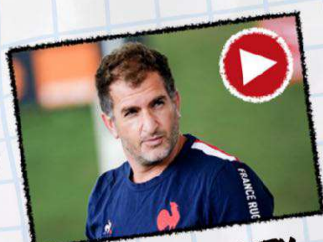
ÉDITO DU DTN