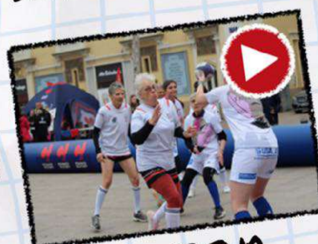
FOCUS SUR LE RUGBY À 5 SANTÉ