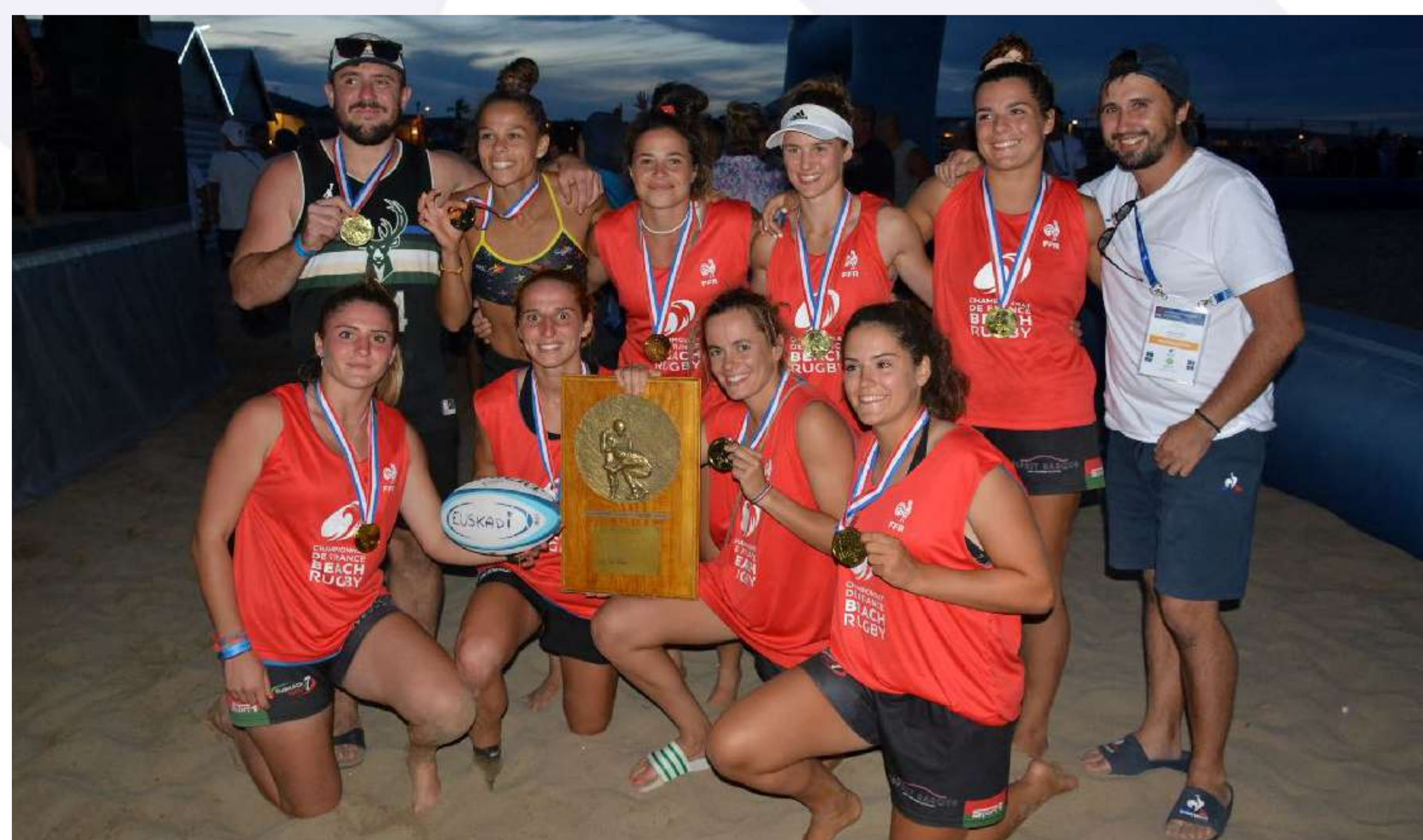
Championnes de France 2022 : Euskadi Sevens

Ainsi, 12 équipes masculines et 8 équipes féminines se sont disputées les titres de Championne et Champion de France de Beach Rugby 2022 et ont permis de décerner les titres suivants :