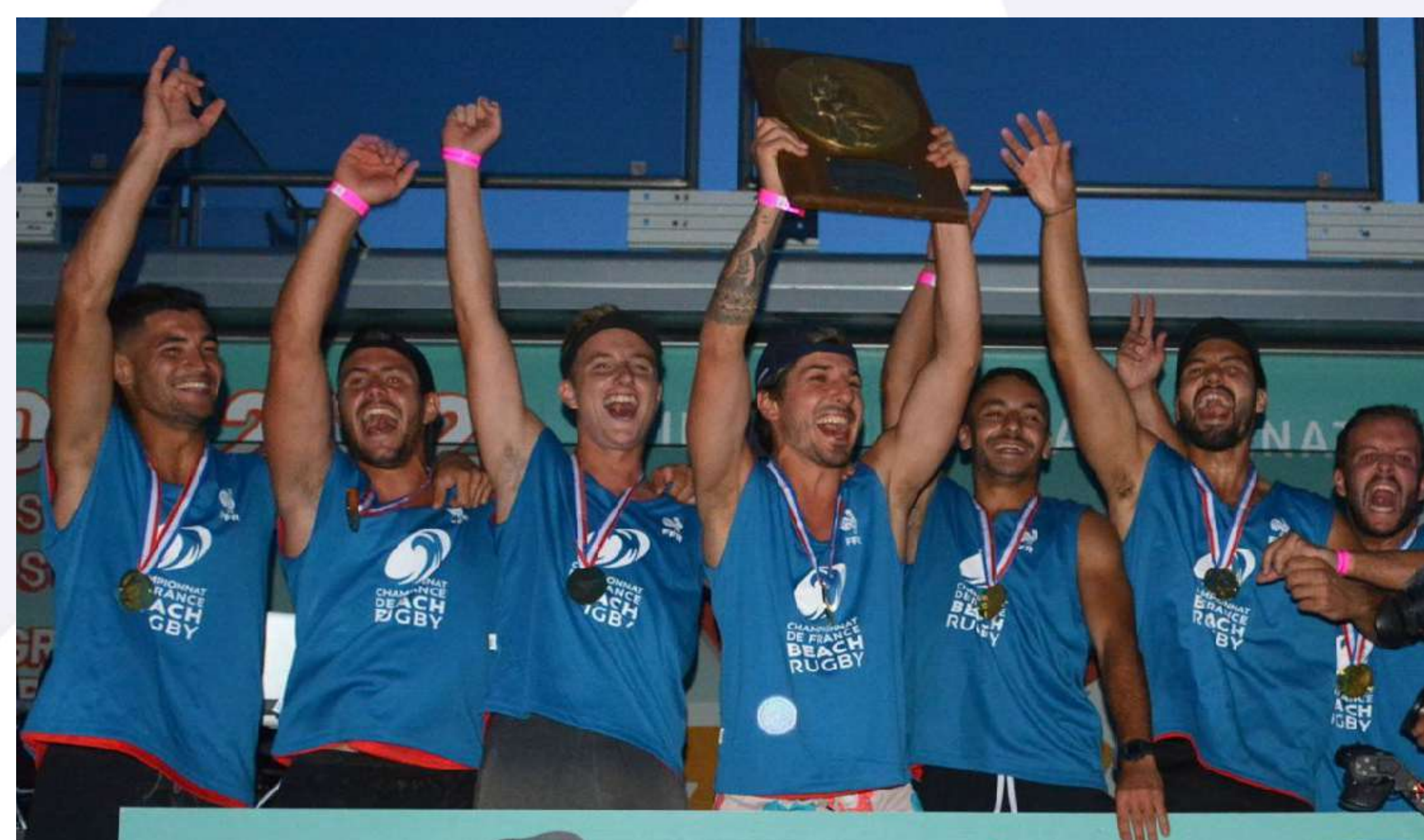
Champions de France 2022 : Les Minots de Provence

La FFR remercie tout particulièrement les bénévoles, les techniciens de la ligue et de la ville pour leur aide sans faille dans la mise en œuvre de cet événement et vous donne rendez-vous l'année prochaine sur les plages françaises.