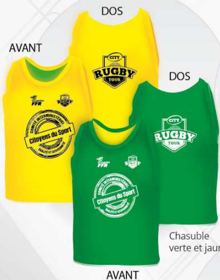
Chasuble verte et jaune

départ atelier Livraison directe aux comités régionaux