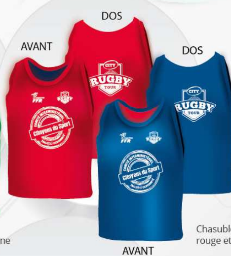
Chasuble rouge et bleu